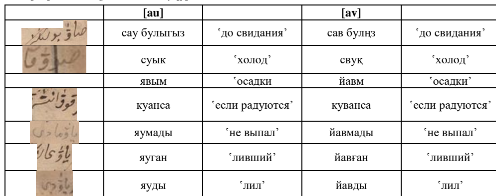
Table 7. [ыв] according to the literary [у].

По употреблению [-ыв], [-ев] система дифтонга максимально приближена к современному говору нагайбаков. По исследованиям Ф.Й. Юсупова употребление дифтонгов (-ыв, -ев) составляет изоглоссу, присущую для говоров Уральского региона (говору пермских, злаустовских, касимовских, хвалыньских татар и говору сафакульских, учалинских тептярей) [8: 173]. Данная особенность показывает общность и с говорами крещеных татар [14: 52].